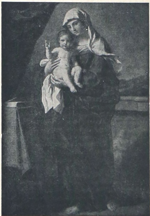
YESU I TAU MAKAWADASI